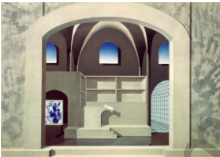
Hommage a' Messina II Malerei

Sie lief in orientalischen Gewändern herum, redete wirres Zeug, reiste gerne in der Welt herum, vergnügte sich mit heruntergekommenen Gestalten, verabscheute jedes hochtrabende Geschwätz, ernährte sich von Menschenfleisch und war immer zum Spaß aufgelegt, wobei sie vor allem mit mir gerne ihren Spott trieb.