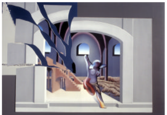
Das Haus der Puppe Malerei, Collage mit Spiegelfolie

Der Knoten platzt und ich schwebe vor Freude auf zwei dicke Milchbrüsten am Horizont zu. Doch mit Entsetzen sehe ich aus den großen Brustwarzen Ameisenkolonnen herauskrabbeln.