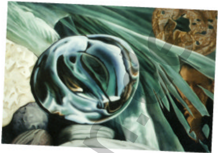
Totem IV Malerei Collage mit Spiegelfolie

"Das war schon immer dein Traum, eine Frau, die dich von vorn bis hinten bedient. Außerdem ist sie eine Traumfrau aus 1001 Nacht, was willst du mehr,...?!"