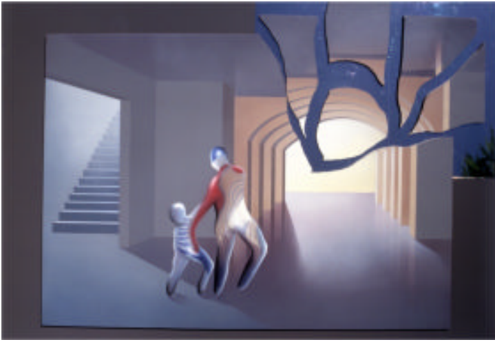
Unter der Stadt Malerei, Collage mit Spiegelfolie

Wir flüchten vor der bunten Scheinwelt in das Untergeschoss des Kaufhauses. Als wir die Treppen hinuntergehen, sind wir plötzlich nackt.