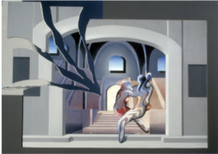
Das Haus der Liebenden Malerei, Collage mit Spiegelfolie

Ein geiles Wohlgefühl erfasst mich von Kopf bis Fuß. Plötzlich bekomme ich Angst, ich weiß nicht wo oben und unten ist. Vergeblich nach Halt suchend rudere ich in der Luft.