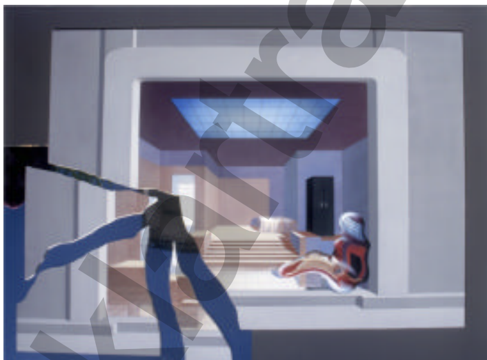
Das Haus der Geliebten Malerei, Collage mit Spiegelfolie

Ich komme mir beschissen vor und suche in der Stadt Geborgenheit. Missmutig sehe ich mich in einem Juweliergeschäft nach einem kostbaren Ring für eine Frau um. Es ist wie verhext, in dem Laden bedient mich wieder die "Traumfrau aus 1001 Nacht".