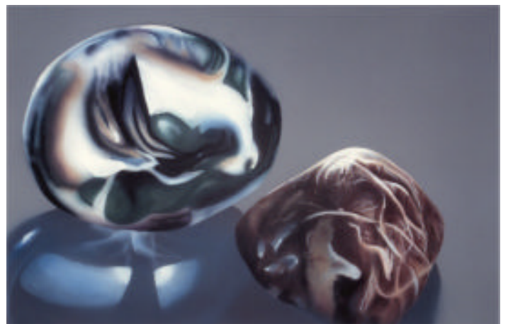
Kiesel mit Glas VIII Malerei