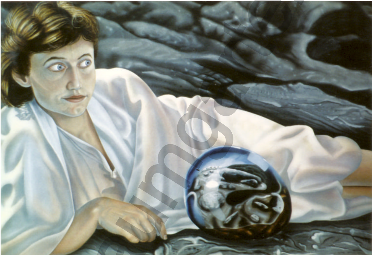
Im Lauf des Flusses Malerei*

Eine klar-träumende Bildergeschichte von Klaus- H. Schader