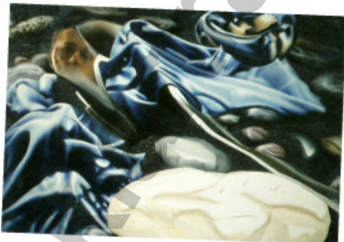
Unter der Stadt Malerei, Collage mit Spiegelfolie

Im Traum ist der Tod so leicht wie Schaum und das Leben schwebt wie ein Ballon zwischen Himmel und Erde davon."