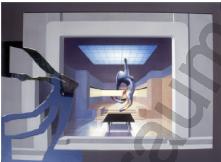
Das Haus der Köchin Malerei, Collage mit Spiegelfolie

Als ich den Verursacher des Traumgedichtes erkenne macht sich die Übermutter aus dem Staub.