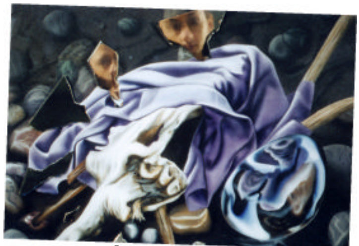
Totem IV Malerei Collage mit Spiegelfolie

Ich lande auf einer grünen Flussaue. Mitten auf der Flussaue steht ein Asylantenheim. Da die Asylanten im Inneren des Hauses keinen Platz für ihre armseligen Habseligkeiten haben, verstauen sie sie außerhalb des Hauses unter Zeltplanen.