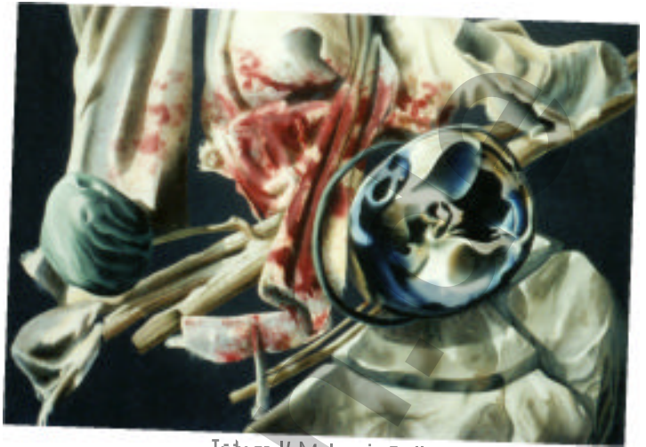
Totem II Malerei Collage mit Spiegelfolie

Ihr, die eine Reihe meiner Arbeiten beeinflusst hat, möchte ich die folgende Tonbildschau widmen, wo ihr Einfluss auf mich in besonderem Maße verdeutlicht wird.