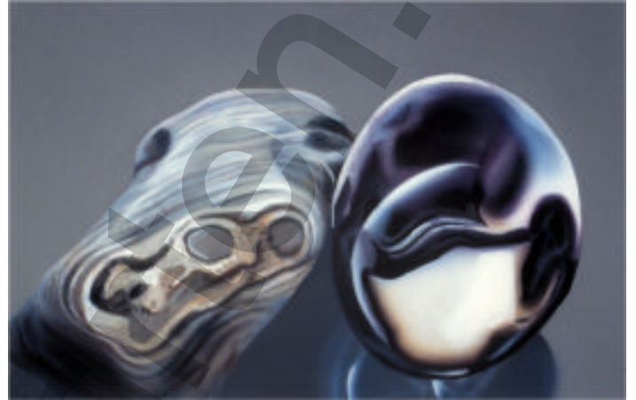
Kiesel mit Glas VI Malerei

Ich nehme einen Splitter und lasse ihn das Mädchen berühren. Ich sage ihr: "Es ist der Tod, vor dem wir uns in der Dunkelheit fürchten."