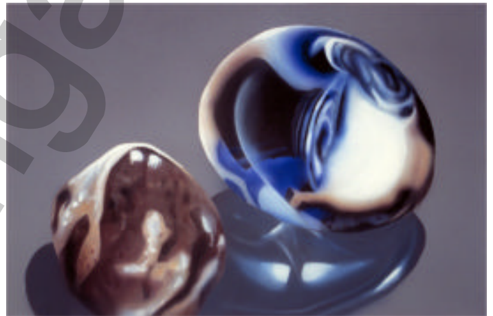
Kiesel mit Glas VII Malerei