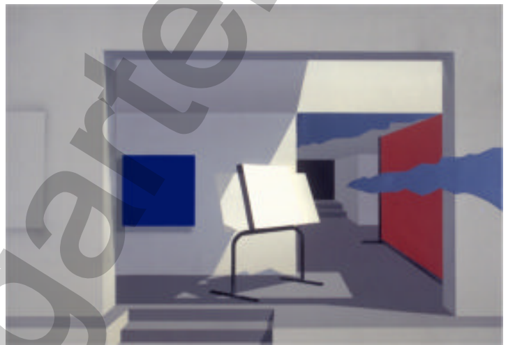
Wer hat Angst vor Rot-Blau-Weiß? Malerei, Collage mit Spiegelfolie

Die Gestalten, die sich hinter den liebenden und streitenden Paaren verbergen, sind das Figuren paar "Schwarz" und "Weiß", die mir die Weissagerin geschenkt hat! Nachdem ich das Gaukelspiel meiner Ängste und Wünsche durchschaut habe, kann ich befreit das große weiße Papier bemalen.